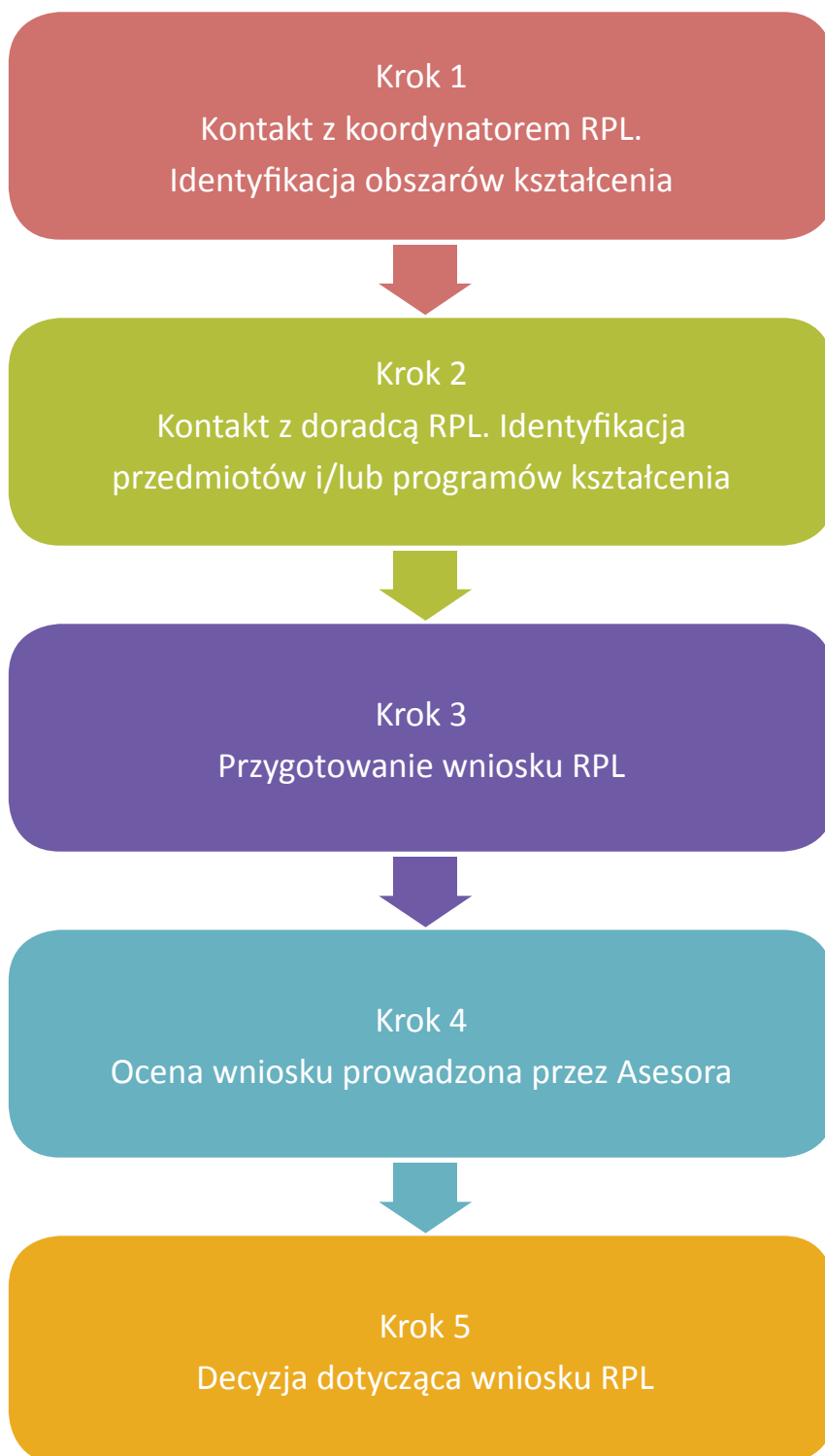
DIAGRAM PROCESU RPL