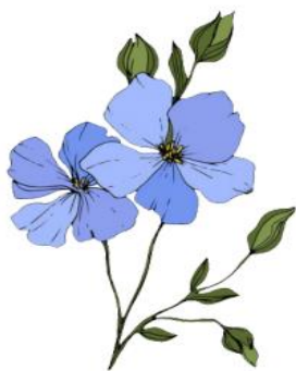
Kwiat Inu – symbol Rzezi Wołyńskiej